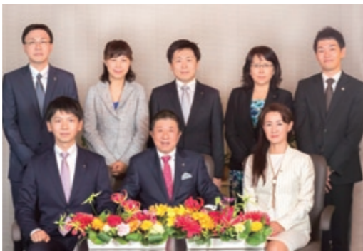
あらゆる相続の相談に対応する、あすか税理士法人の税理士

「イスも行っていきます」と言う。地域ごとの特性に応じたきめ細かな対応、革新的な問題解決能力、厳格な法解釈に基づく税務当局との交渉力。これらの総合力によって、あすか税理士法人は高い信頼を得ているようだ。